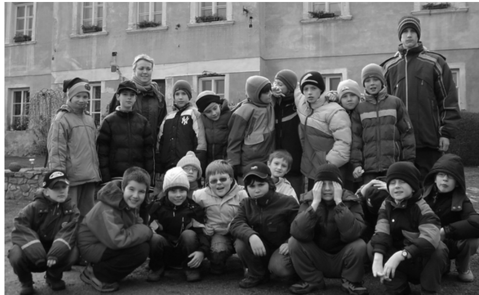
Také letos vyrazili Pueri 3 na soustředění do Pyšel.