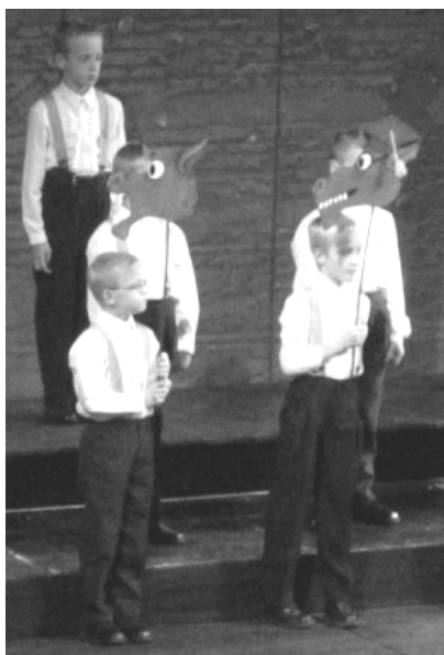
Koncert ve Státní opeře představil všechna oddělení sboru včetně Pueri 1 (více na str. 2).

Neděle se nesla ve znamení koncertu. Na Hrad jsme dorazili již tři hodiny před začátkem.