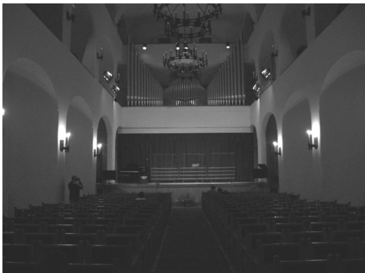
Někdejší kaple štětínského zámku podpořila náš koncert jedinečnou akustikou.