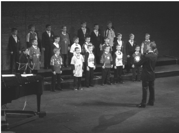
Fotbalisti v podání Pueri 3 jsou neodolatelní.